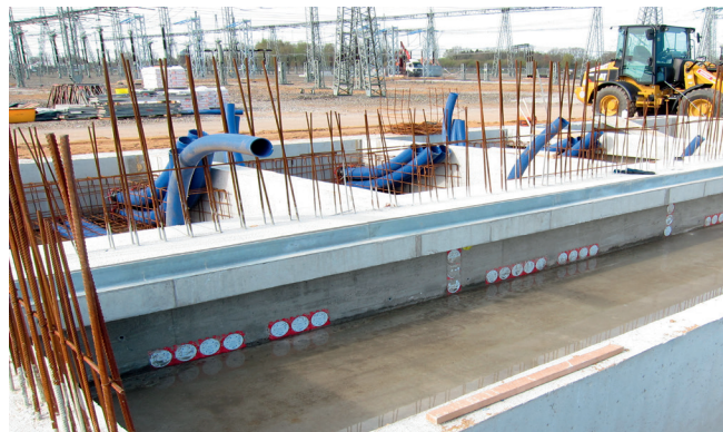
A rugalmas KES-M 150 kábelátvezetési rendszerek telepítése Hateflex 14150-nel és KES M 90-nel és Hateflex 14090-nel.