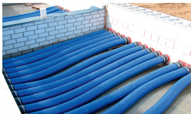
A 14090 KES-rendszereket mandzetta technikával csatlakoztatták a bebetonozott HSI 90 tömítőcsomagokhoz.